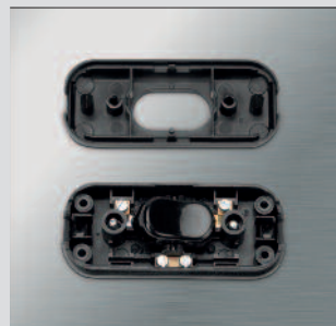
Interruttore rompipilo a cursore; con morsetto passante per cavo piatto.