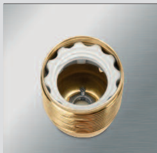
Portalampada in metallo: visibili la vite di bloccaggio.