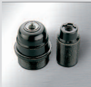
Portalampada in termoplastico: a sinistra con attacco E27 camicia liscia e nippel in metallo; a destra con attacco E14, camicia filettata e con filetto stampato.