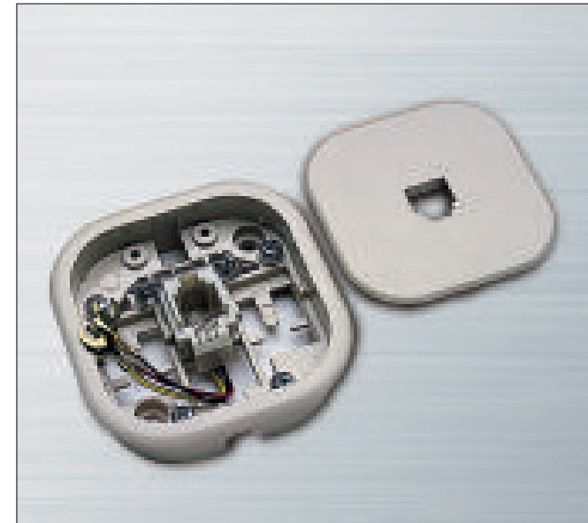
Base mural y empotrable para 1 PLUG 6/4.

Scame propone al instalador calificado una serie de productos que pueden satisfacer casi totalmente las exigencias más comunes de cableado y de expansión de la instalación telefónica.