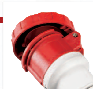
Kryt káblovej zásuvky IP66/67 je strojne opracovaný pre ľahké uzatváranie.