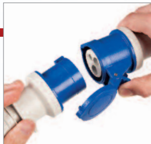
Úchop víčka má nový ergonomický tvar pre jednoduchšie použitie.