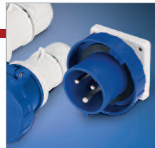
Séria Optima súčasne prináša kompletný sortiment panelových prívodiek.