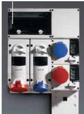
Série ADVANCE 2 Sistema modular para baterias de distribuição