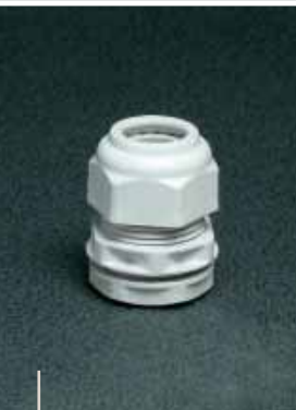
Conexões de rosca