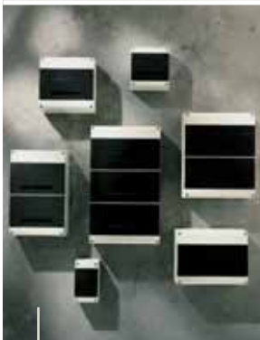
Série DOMINO Centrais