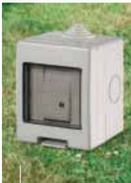
Série UNIBOX Séries modulares para uso doméstico