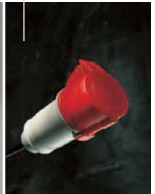
Série EUREKA Fichas e tomadas para uso industrial