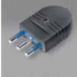
Série AZZURRA Fichas e tomadas para uso doméstico