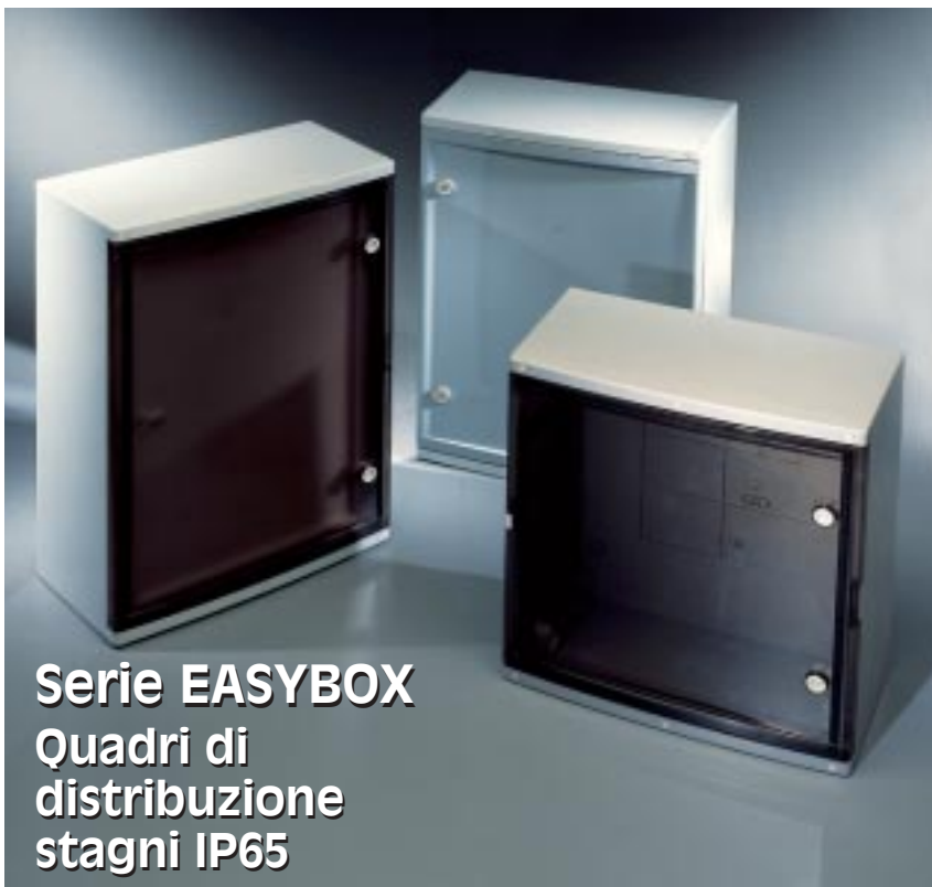
Serie EASYBOX Quadri di distribuzione stagni IP65